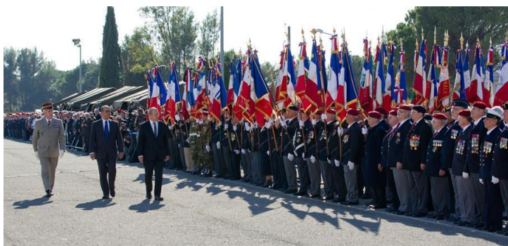
Les ministres et le CEMAT passent les troupes en revue